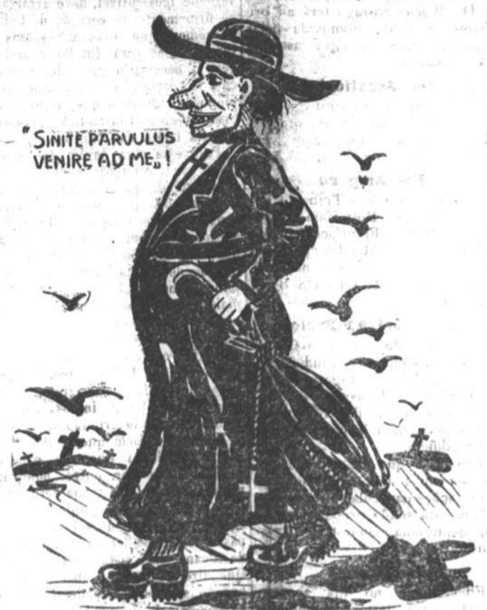
— Sim, deixai vir a nós os pequeninos, porque conosco ellos ficarão convenientemente preparados para honrar o reino dos bemaventurados...

Nessa capital existem praças proprias para esse nefando mirir e, dentro os vossos sequezes, não faltará quem ponha em execução a execravel obra; só assim ao descer o panno, após o ultimo acto do monstruoso drama, teres tido o ensejo de oferecer aos vossos correligionarios o espectáculo que mais lhes agrada e que anciosos almejam. O immune e seraphico pastor do celebre orfanato que, na expressão do Guerra Junqueiro 'E' tudo o qu' ha de mais vil Desde o ventre do sapo á baba do reptil mordido pelo remorso e em desespero de causa, pede com o maior cynismo, para que o matem!